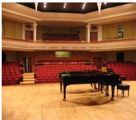
Sala Koncertowa w budynku żółtym